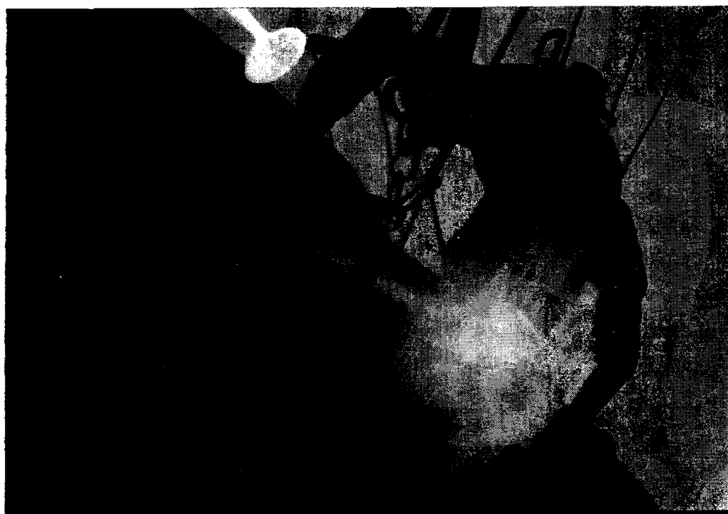
Contraluz en el segundo techo.

El tiempo ha pasado, pero en nuestra mente perdura la incógnita dei