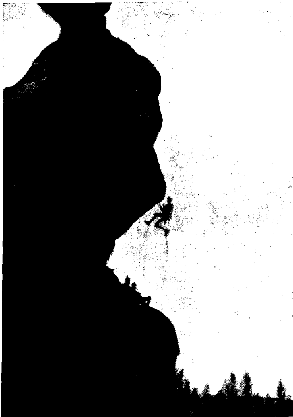
Superando el primer techo.