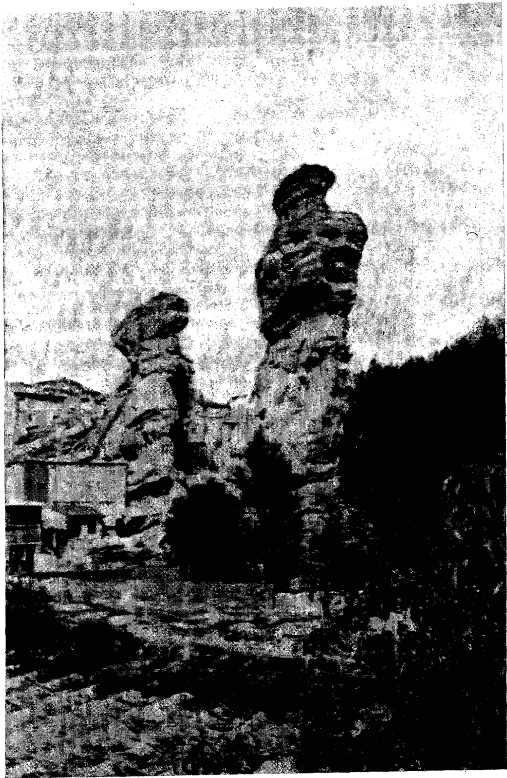
Vista de conjunto: Picuezo y Picueza.