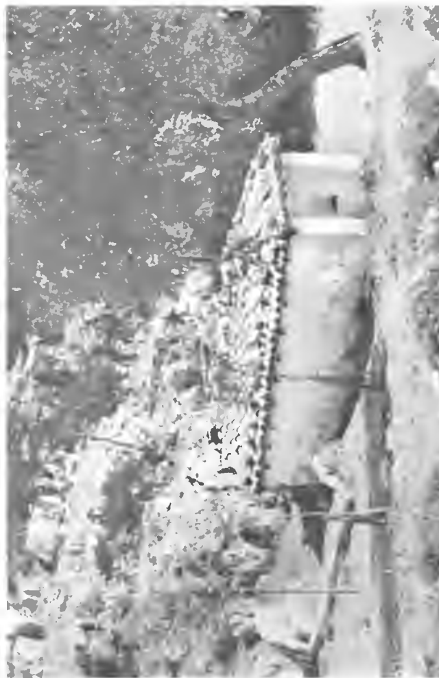
Txabola de Lapatza en

La más occidental y separada del conjunto principal, la pétreo cima de Aitz-Zorrotz (738 m.), rematada por la ermita de