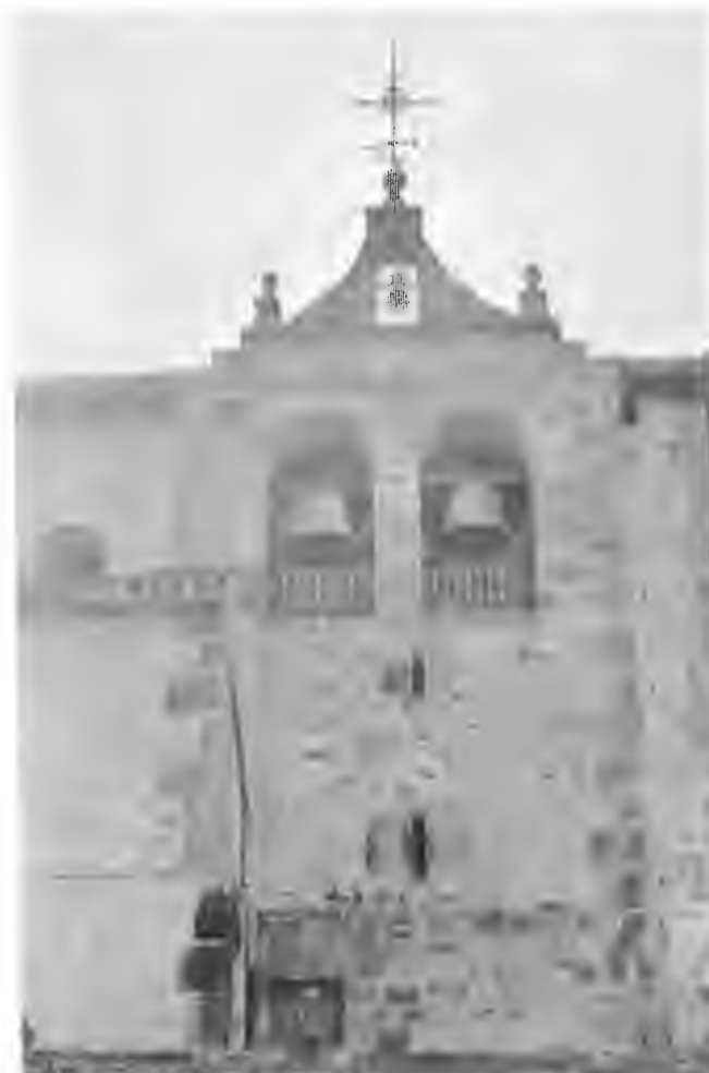
Iglesia de Bolibar

Las hojas de las hayas, recubren este labrado camino. ¡Cuántas historias y leyendas nos relataría si tuviera la facultad de hablar! Se aprecia aún las rodadas de los carros que por aquí transitaron, huellas que desaparecerán, ya que éstos hace años que han dejado de pisar estos caminos. Cualquier punto del camino es lo bastante bueno para subir al Andarto, pero se elige un rellano de abundante haya donde un raquítico cercado puede servir de indicador. El camino asciende por la ladera rocosa Norte de dicho monte, describiendo un arco para alcanzar Digurixako-arratea (945 m.), portillo de paso a la depresión de Deguria. Desde aquí también es posible ir a Andarto, pero es más incómodo por la desigualdad del terreno. Desde dicho rellano, se remonta primero por el hayedo en dirección Sur, pisando la consabida hojarasca. Salidos del bosque, se