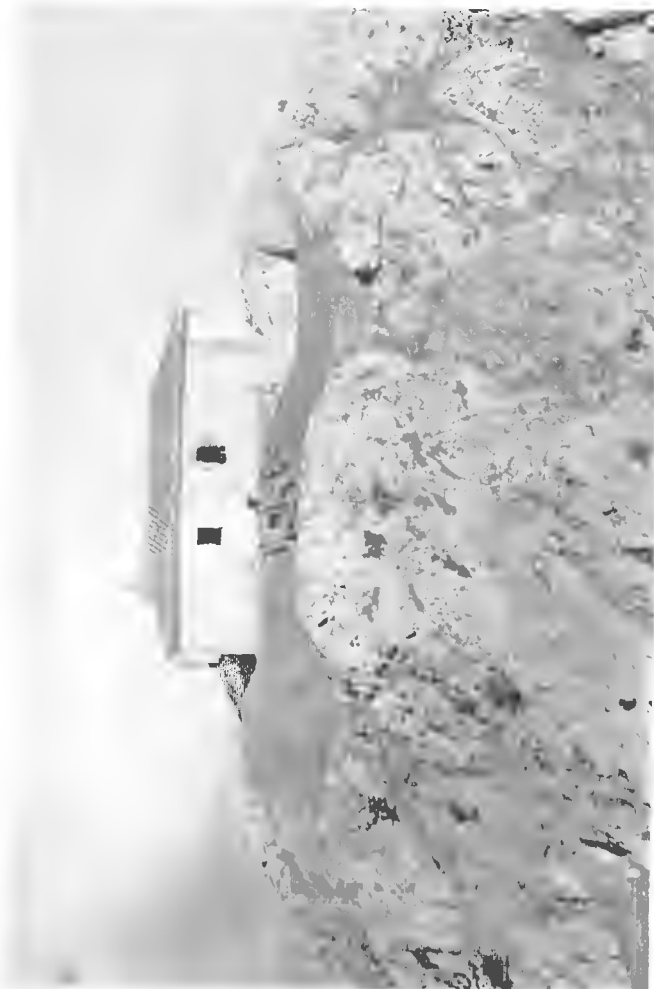
Ermita de la Ascensión de San Juan Txiki o por San Juan Txiki

A poco más de mitad de camino entre Mendiola y Udalatza, se encuentra el paraje de Eleizabarri. Una fuente y el espacioso hayedo, refrescan y dan sombra al andarín que remonta la empinada cuesta, que asciende desde el citado Mendiola. Más hacia el exterior y sobre un raso, otea el valle, la ermita de San Juan Anteportaminam (conocida por San Juan Txiki o por